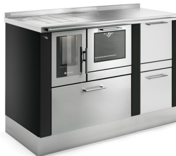
PELLET 90 PANORAMA + PELLET TANK Noir F5 / Inox