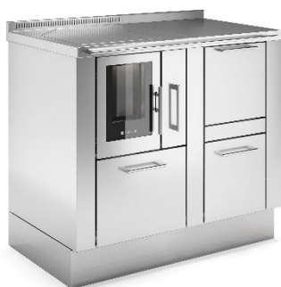
PELLET 60 PANORAMA + PELLET TANK Inox