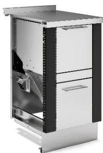
PELLET TANK Noir F5 / Inox