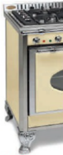
Finition inox : profils inox brossés. Cadres chromes brillants ou brossés. Façade émaillée