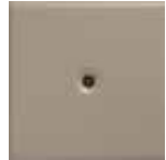
M 3 tortora