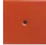
M 8 aragosta