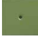
M 13 verde chiaro