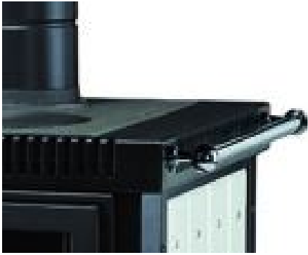
Main courante sur les côtés