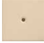
M 6 avorio