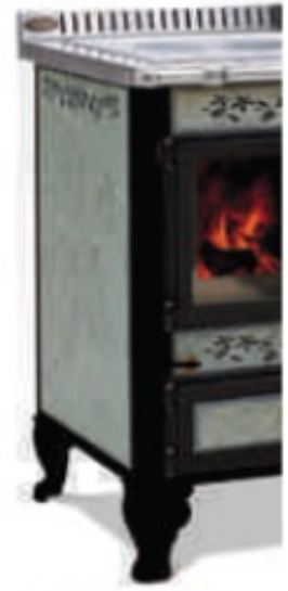
Finition rustique : profils et cadres en fonte peintes noires. Façade pierre