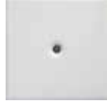
M 7 bianco