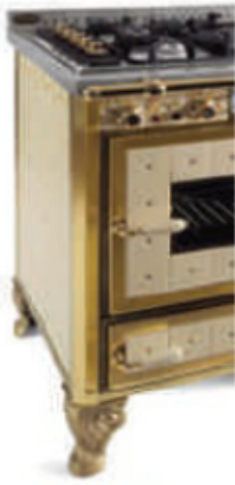
Finition laiton ou laiton vieilli Façade carrelée