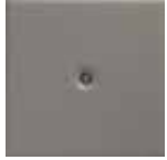
M 9 grigio fumo