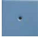
M 12 carta da zucchero