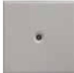
M 11 sabbia matt.