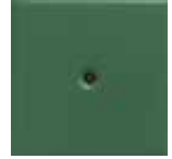
M 14 verde scuro