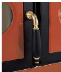
Laiton ou chrome, porcelaine blanche, noire ou ivoire