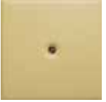
M 1 giallo chiaro