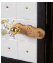
Rustique : chrome ou laiton