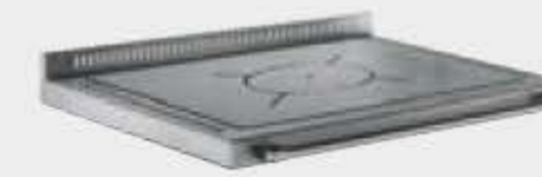
Plaque satinée avec cercle unique