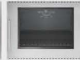
Porte four à ouverture latérale