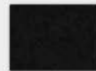
Noir absolu (F5)