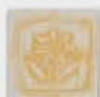
Carrelage ou Faïence