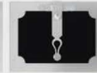
Porte four avec décoration