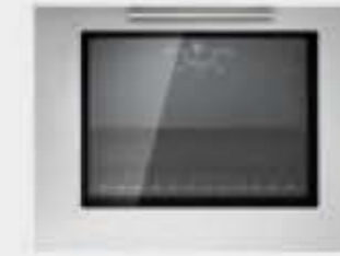
Porte four avec vitre