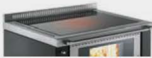
Plaque en vitrocéramique