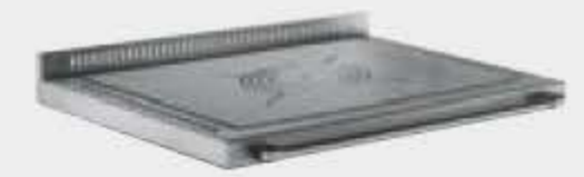
Plaque satinée avec anneaux