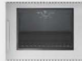
Porte four à ouverture latérale