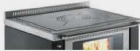
Plaque en acier satinée avec anneaux