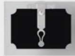
Porte four avec décoration