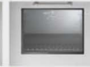
Porte four avec vitre et éclairage intérieur