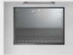
Porte four avec vitre et éclairage intérieur