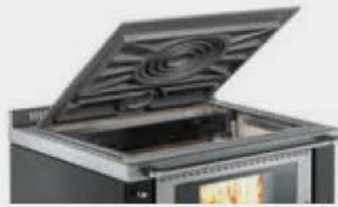
Plaque en fonte avec cercle unique ou anneaux (disponible uniquement pour Ökoalpin 60/60BU/70BU)