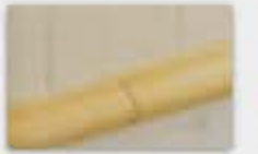
Faïence ou carrelage