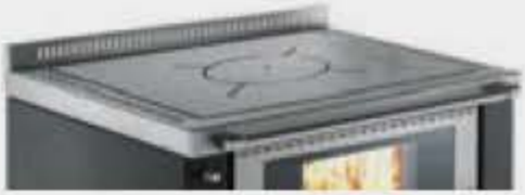
Plaque en acier satinée avec cercle unique