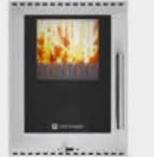
Porte foyer triple vitre autonettoyante