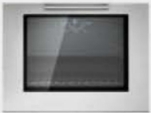
Porte four avec vitre