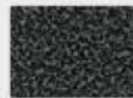
Noir argent (F1)