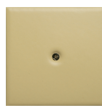
M 1 giallo chiaro