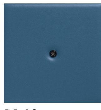
M 10 azzurro