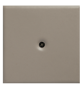
M 3 tortora