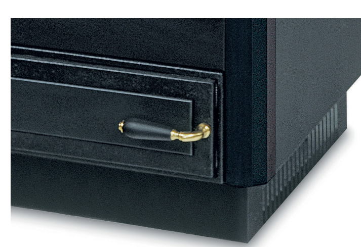
PLINTHE PEINTE OU INOX