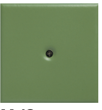
M 13 verde chiaro