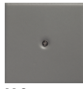
M 9 grigio fumo