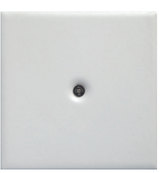
M 7 bianco