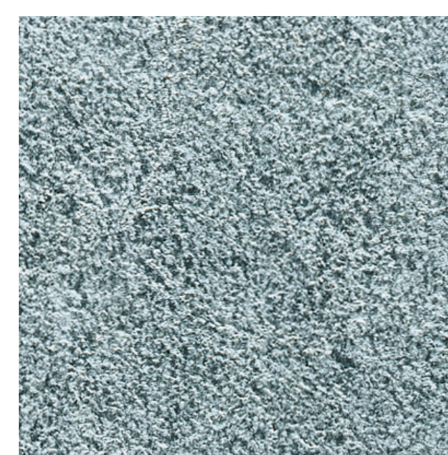
MODÈLES 85-90-140 OU SUR DEMANDE