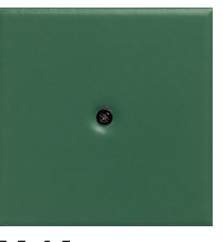
M 14 verde scuro