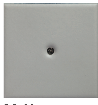
M 11 sabbia matt.