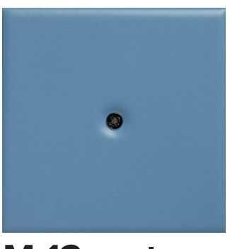
M 12 carta da zucchero