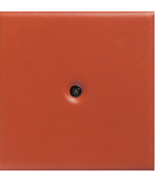
M 8 aragosta