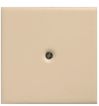
M 6 avorio